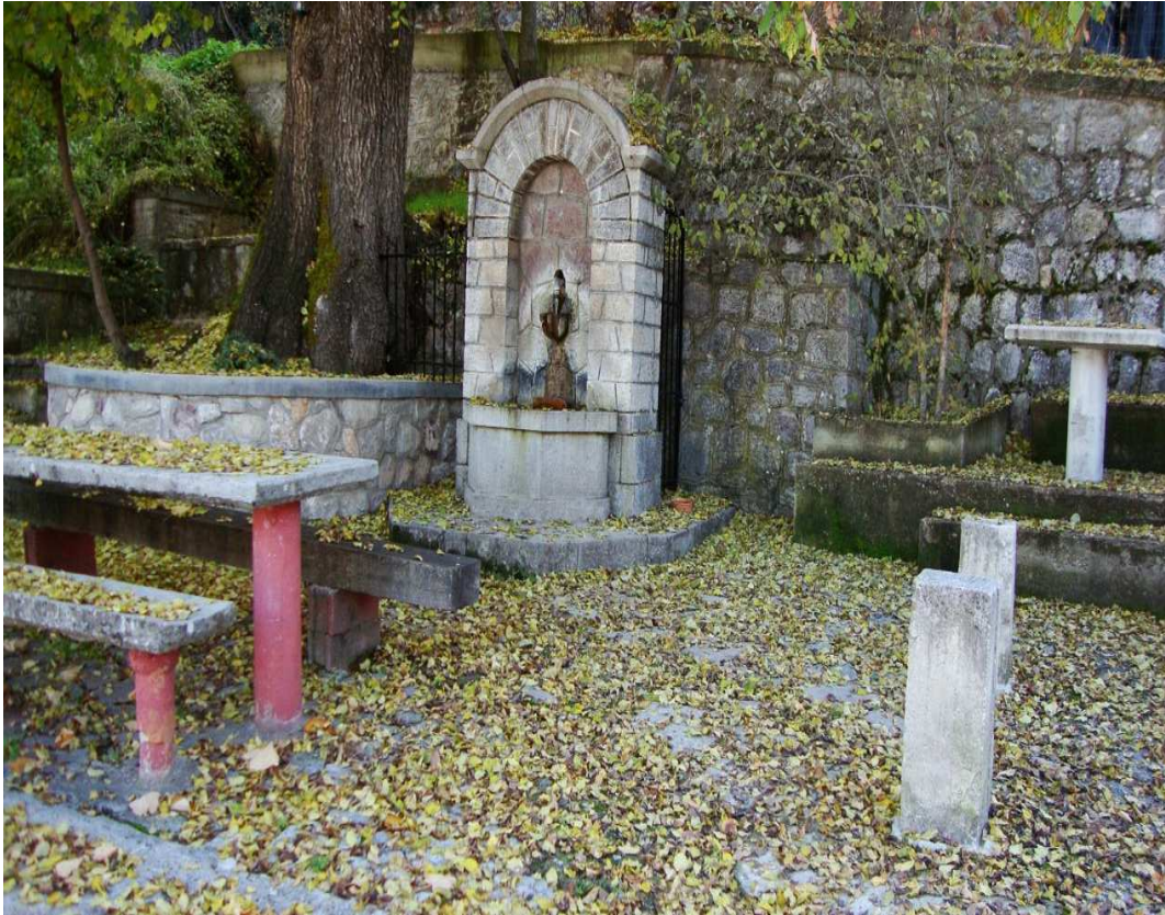
Βρύση στο Μοναστήρι