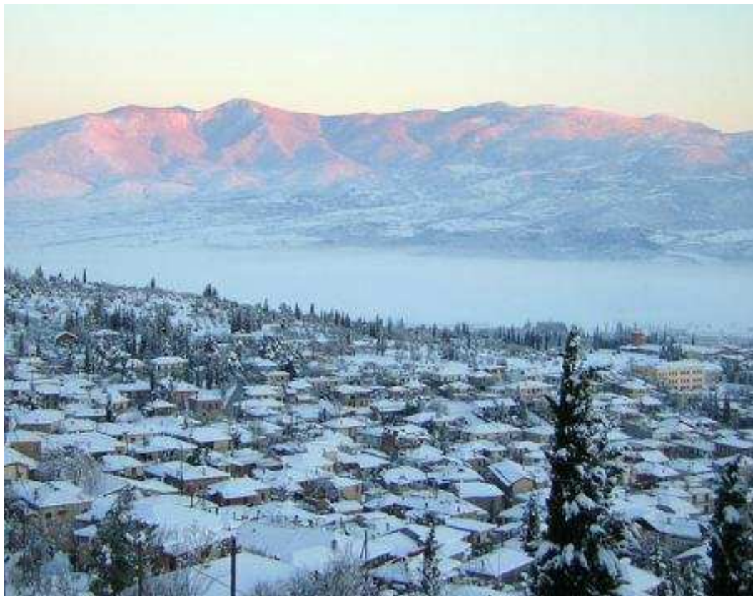
Άποψη του Κηφισού με τη χιονισμένη Αμφίκλεια