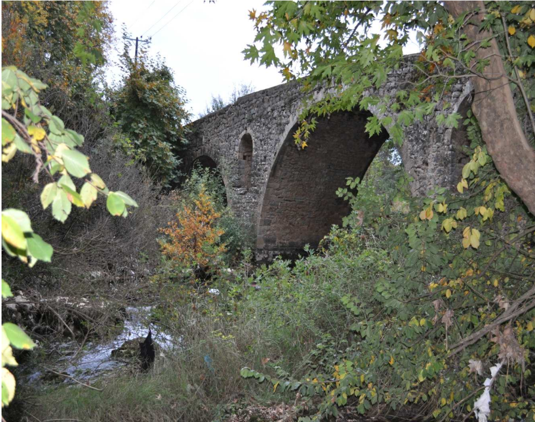
Πέτρινο γεφύρι στον Κηφισό