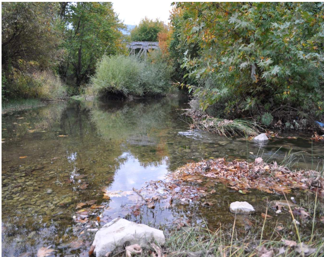
Γέφυρα σιδηροδρομικού σταθμού στον Κηφισό