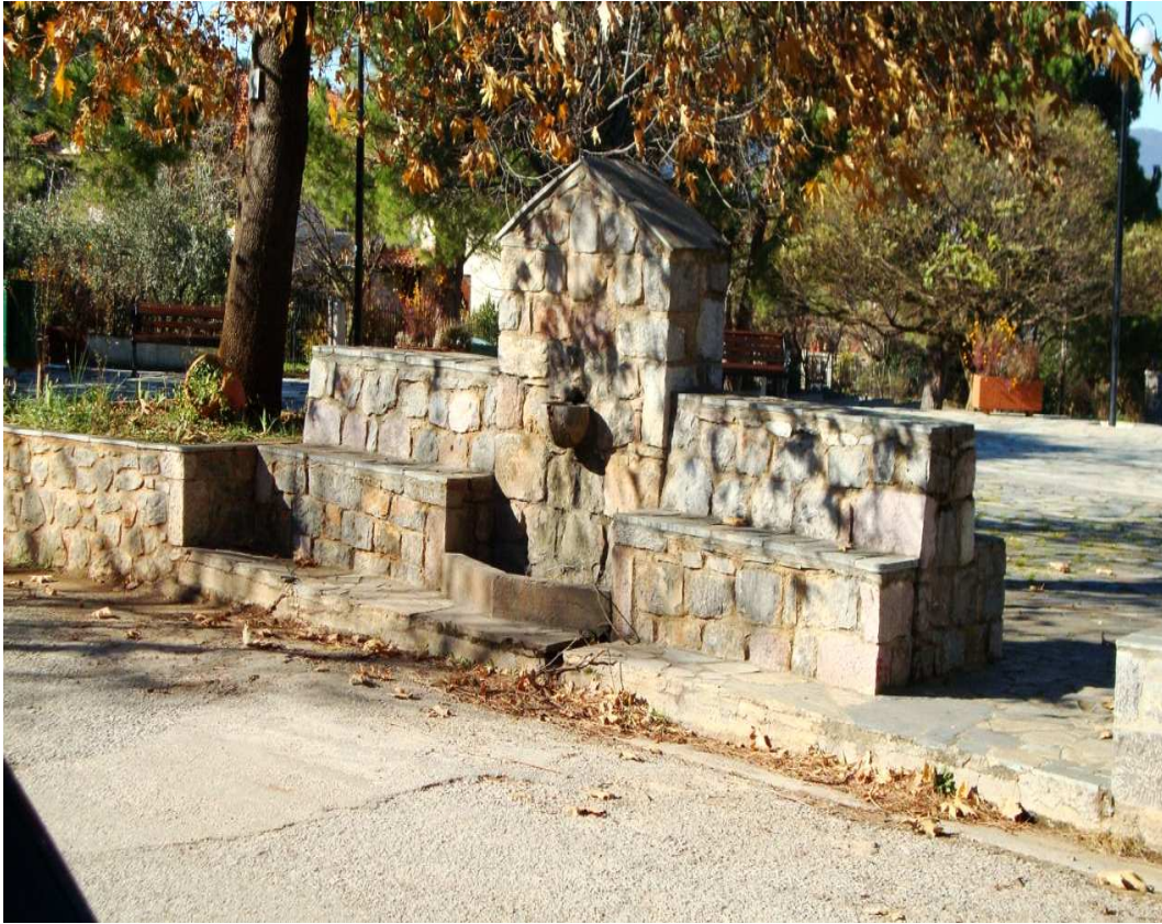
Βρύση στην πλατεία Κουμπουριανών