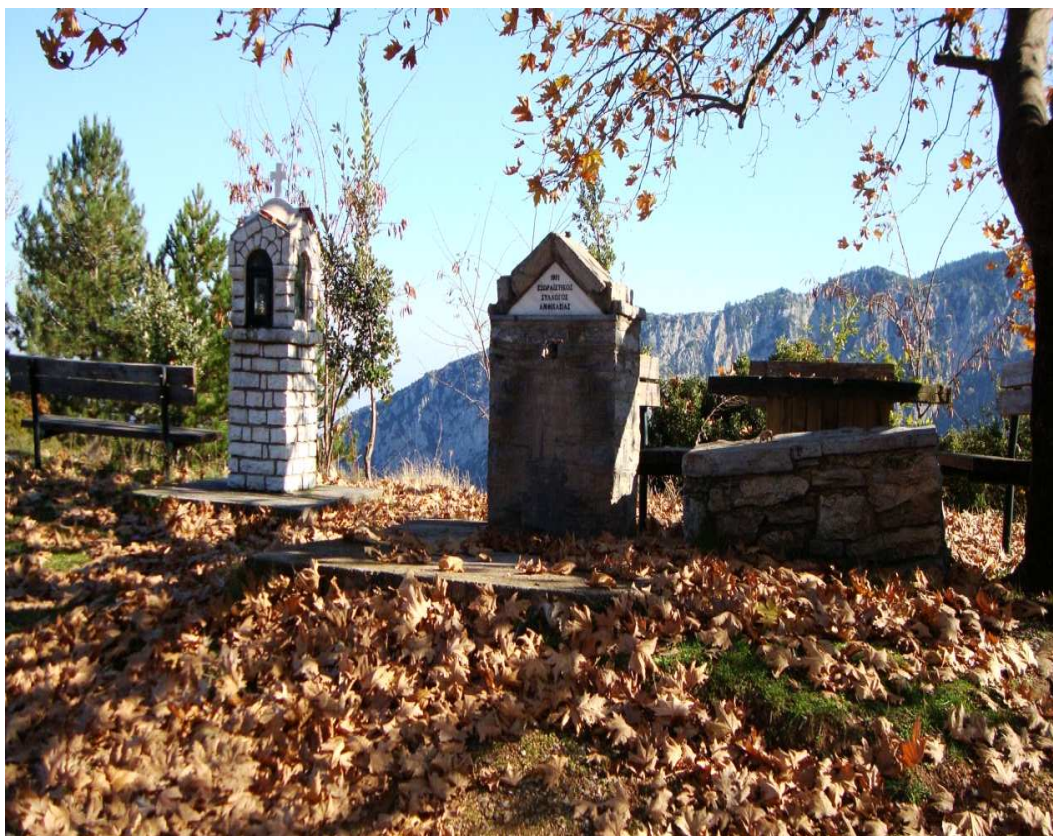
Βρύση στο "Αλωνάκι"