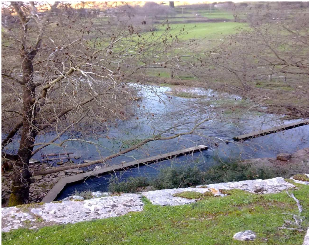
Πολύδροσος, "Αγία Ελεούσα" Πηγές Κηφισού